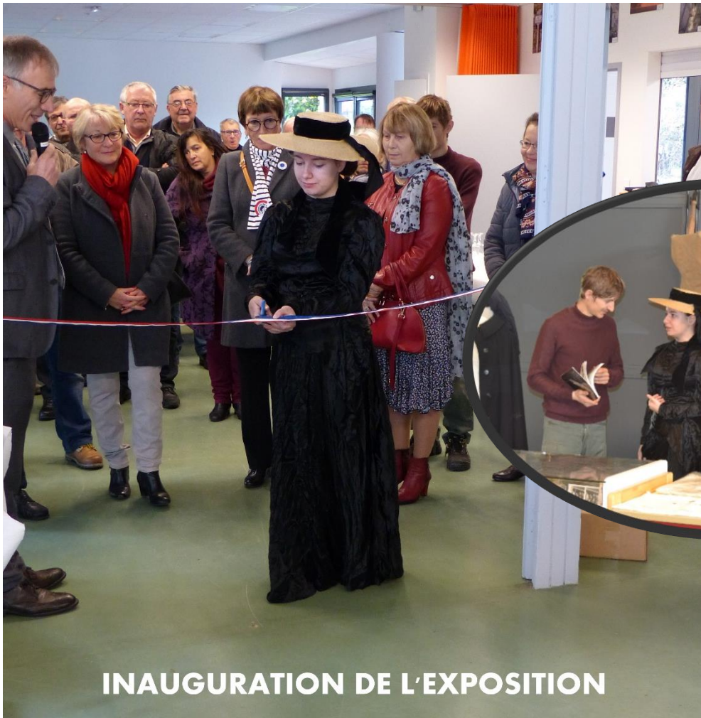
INAUGURATION DE L'EXPOSITION