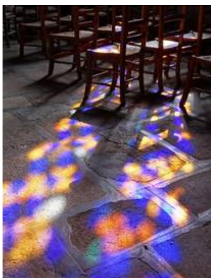
« Lumière du matin dans l'église » de Patrick Celton

Les 20 photos primées sont exposées en mairie, dans la salle du conseil. L'exposition est visitable pendant les heures d'ouverture de la mairie. Les 6 premiers prix sont exposés en grand format sur l'allée Hervé Goaër, à proximité de l'aire de jeux.