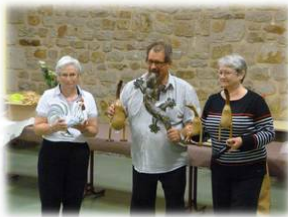
Echange de cadeaux entre présidents