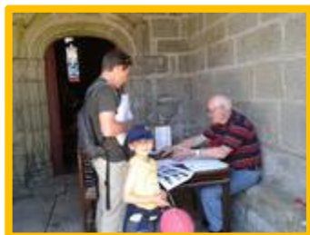
Cluedo : passage des concurrents pour répondre au questionnaire concocté par l'association

Les Journées du Patrimoine se tiendront les 20 et 21 septembre . Le thème de cette année « Patrimoine culturel, patrimoine naturel » nous amènera en collaboration avec le comité d'animation à découvrir, à travers un circuit, les éléments naturels, l'histoire, le patrimoine de notre environnement quotidien.