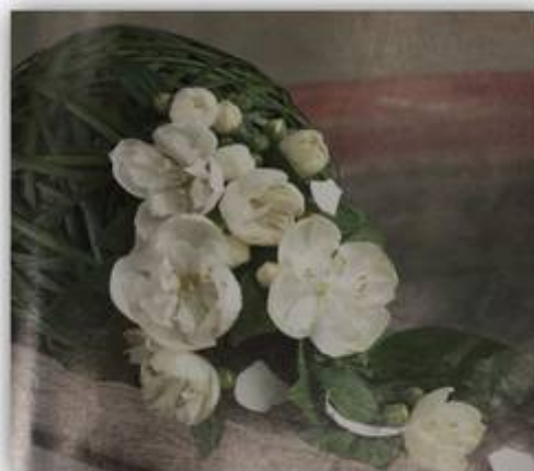
Au programme de septembre : Sphère décorative