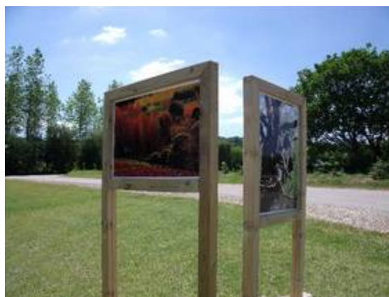
Les 6 premières photos sont exposées allée Hervé Goaër